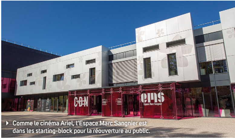
► Comme le cinéma Ariel, l'Espace Marc Sangnier est dans les starting-block pour la réouverture au public.

Les annonces gouvernementales du 10 décembre ont encore eu raison du secteur culturel, qui s'était pourtant préparé à rouvrir ses portes.