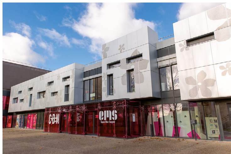
*** L'Espace Marc-Sangnier, flambant neuf après des années de travaux !

Direction de la culture : 02 79 18 99 00.